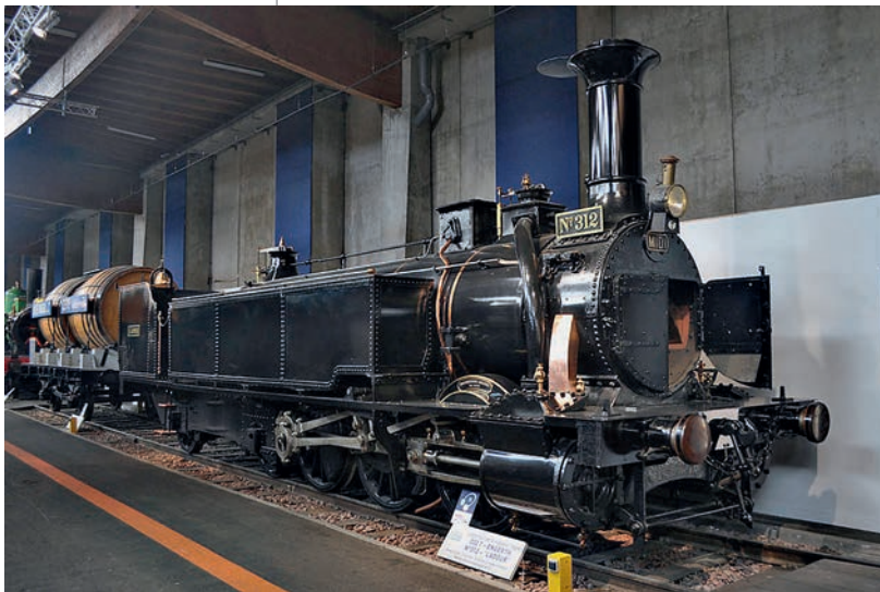
Abbildung 2: Eine württembergische Lok aus dem Jahre 1856

Ulm, von da aus die Südbahn nach Friedrichshafen am Bodensee, die Westbahn in das in Baden gelegene Bruchsal und die Nordbahn über Bietigheim nach Heilbronn realisiert.