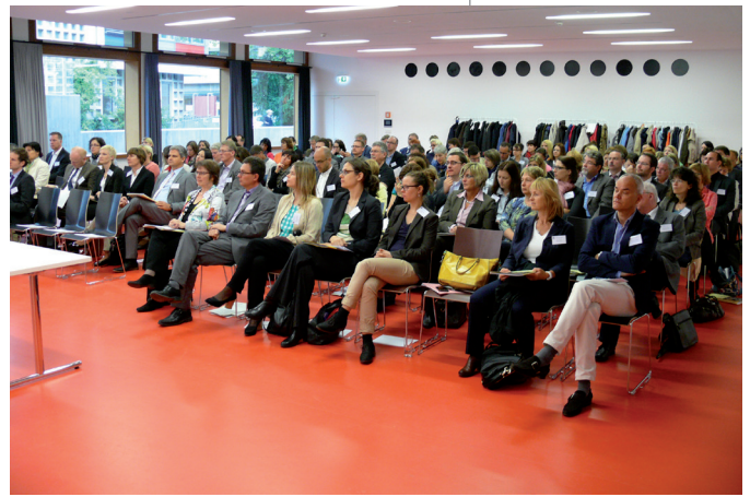
Zweites BW-Forum für Personalverantwortliche im Öffentlichen Dienst am 7. Mai 2014 im Hospitalhof Stuttgart

Wir wollen gutes und geeignetes Personal suchen, finden und halten! Das erfordert mittlerweile ein hohes Maß an Einsatz und kreativen Ideen“, so Zinell . Als Mitglied der Arbeitsgruppe „Der öffentliche Dienst als attraktiver und moderner Arbeitgeber“ im Rahmen der Demografiestrategie der Bundesregierung berichtete er über die Themen, die in der Arbeitsgruppe diskutiert wurden: Personalbedarfsanalyse und Wissensnachschub, familienfreundliches Arbeiten und Arbeitsfähigkeit der Beschäftigten erhalten. Auch kulturelle Leitlinien kamen zur Sprache: „Wer gelobt wird und Anerkennung sowie Wertschätzung im täglichen Umgang erfährt, kommt gerne ins Büro und ist auch leistungsfähiger und leistungsbereiter“, so Zinell .