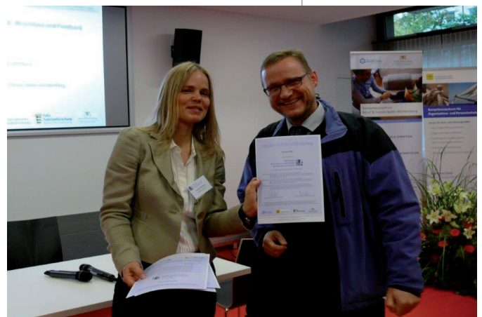
Drittes BW-Forum für Personalverantwortliche im Öffentlichen Dienst am 23. Oktober 2014 im Hospitalhof Stuttgart