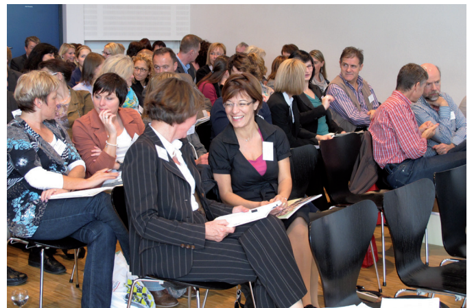
Erstes BW-Forum für Personalverantwortliche im Öffentlichen Dienst am 28. Oktober 2013 im Haus der Architekten Stuttgart