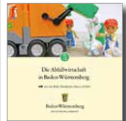
Artikel-Nr.: 2787 14001