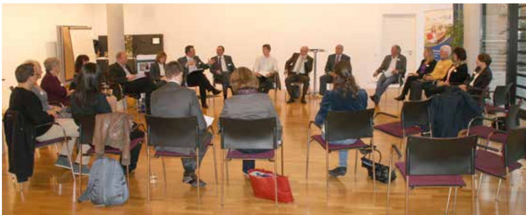
Vernetzungstreffen: Die Kommunen Bad Boll, Dürmentingen und Oberriexingen tauschen sich aus.

Aufgrund des flexiblen Rahmenkonzepts des Projekts konnten die Besonderheiten vor Ort