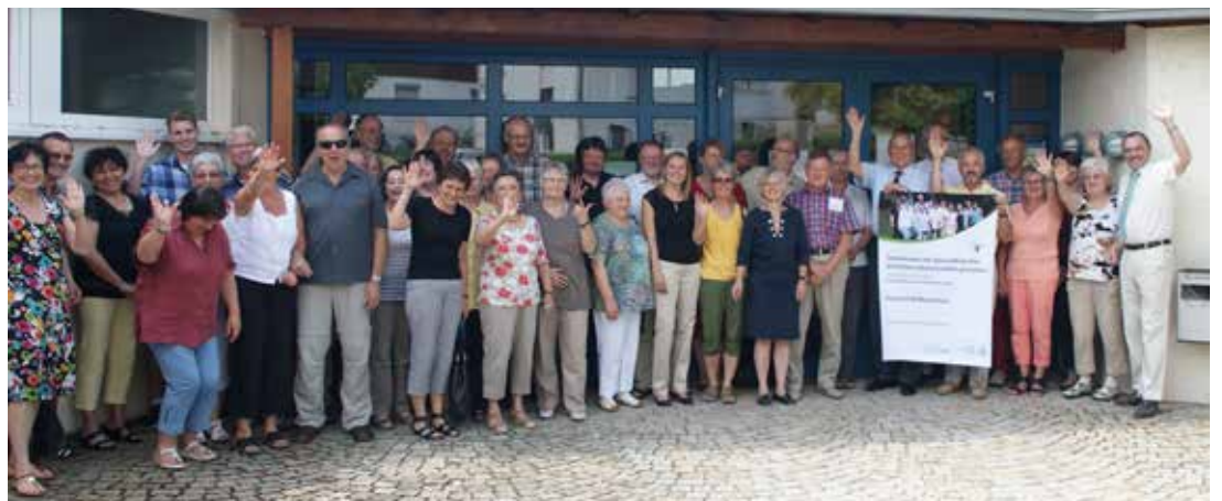
Das BÜRGERFORUM Gesundheit in Oberriexingen

Oftmals zeigte sich in den Vorbereitungsge- sprächen, dass in den Kommunen bereits eine große Fülle an Gesundheitsangeboten vorhanden ist. Es ging häufig auch darum, gesundheitsrelevante Angebote besser bekannt zu machen und übersichtlich darzustellen. Daher war auch der Aspekt Öffentlichkeitsarbeit ein häufig gewähltes BÜRGERFORUMS-Thema. „Wichtig ist, die vorhandenen Angebote zum Thema Gesundheit überhaupt erst einmal zu